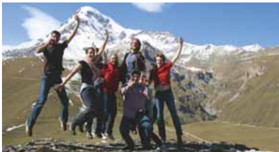
Die Teilnehmer des Sur-Place-Dialogs: Im Hintergrund der Kasbeg, an dessen Gipfel Zeus der Überlieferung nach Prometheus anketten ließ.

Die Idee zu „Recht im Kontext“ entstand aus dem gemeinsamen Interesse an einem Themenkomplex – Law and Development im weitesten Sinne – und einer Region – dem Kaukasus – am Rande des Kreativkolloquiums 2008. Die Berichterstattung über die kriegerische Auseinandersetzung Georgiens und Russlands im August 2008 hatte den Transformationsprozess in Georgien und die bevorstehenden innen- und außenpolitischen Weichenstellungen ins Blickfeld gerückt. Unser Augenmerk galt dabei der Frage, welchen Stellenwert der Aufbau und die Festigung eines funktionierenden Rechtswesens besitzen und inwieweit Recht von anderen Staaten und Akteuren als Instrument der Außen- und Entwicklungspolitik begriffen wird.