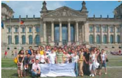
Die Teilnehmer des Symposiums nach dem Besuch im Deutschen Bundestag.

Der zweite Workshop des Tages wurde von der Volkswagen Group China organisiert und widmete sich unter Moderation von Ralf Hanschen drei für ein international tätiges Unternehmen essentiellen Fragen: Wie werden deutsche Angestellte auf einen Aufenthalt in China vorbereitet? Welche kulturellen Missverständnisse können bei einer deutsch-chinesischen Zusammenarbeit in einem Unternehmen entstehen? Wie können Firmenkultur und Produkte an das Gastland angepasst werden, ohne den Kern des Unternehmens zu zerstören?