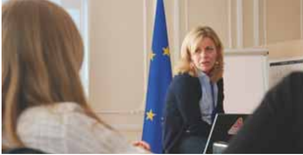
Gespräch mit einer Mitarbeiterin der European Union Monitoring Mission.

ciation ein anderer Wind als bei der EU-Kommission oder der Deutschen Botschaft, auch wenn hinsichtlich der Ziele in weiten Teilen Deckungsgleichheit bestehen mag. Zu keiner Zeit hatten wir jedoch den Eindruck, Zeugen eines „Rechtsexports“ oder gar „Rechtsimperialismus“ zu sein. Diese Titulierungen gehen, so griffig sie sein mögen, jedenfalls für Georgien an der Realität vorbei: Auf georgischer wie ausländischer Seite überwiegt ein nüchternes Bewusstsein für die Probleme des vergleichsweise jungen Rechtssystems. Dieses ist verbunden mit der wohl nicht ganz falschen Überzeugung, dass die Adaption erprobter und bewährter Konzepte nicht die schlechteste aller Lösungen sein kann.