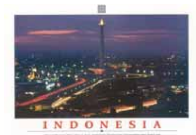
Postkarte aus Indonesien, September 2009.