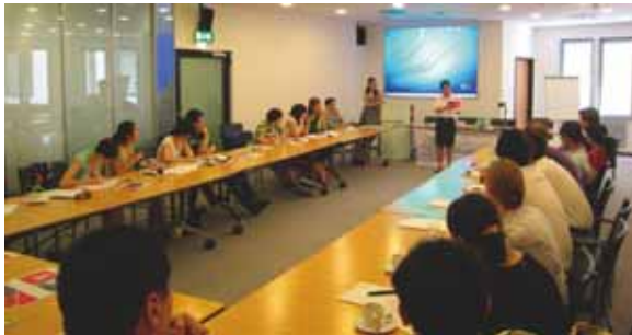
Bei der Vorstellungsrunde im Automobilforum unter den Linden Anfang in Berlin.