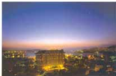
Postkarte aus Südkorea, Oktober 2009.

Eine kleine Auswahl an Postkarten, die Mitglieder des Studentenforums 2009 aus dem In- und Ausland an den Verein gesendet haben.