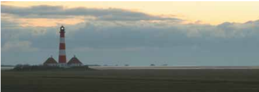
Der Leuchtturm Westerheversand.