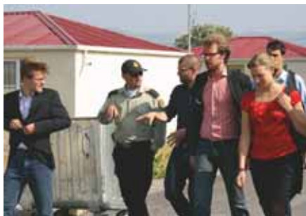
Besuch des Flüchtlingslagers Tserovani, ca. 20 km nördlich von Tiflis.

und in dem mit EU-Unterstützung errichteten Lager Tserovani für Flüchtlinge aus Südossetien hinterlassen. Aber auch die innenpolitische Situation, der Stand der Rechtsstaatsentwicklung und die Situation der Presse waren Gegenstand von Gesprächen mit Vertretern der Zivilgesellschaft, den politischen Oppositionsparteien und Journalisten. Über den thematischen Blickwinkel hinaus bot das Programm zudem ausreichend Gelegenheit, Land und Leute kennen zu lernen. Die landschaftliche Schönheit des verschneiten Kaukasus und die Gastfreundlichkeit der Menschen erlebten wir auf unserer Fahrt entlang der alten Heerstraße und einer Wanderung am Fuße des Kasbeg nahe der Grenze zu Russland.