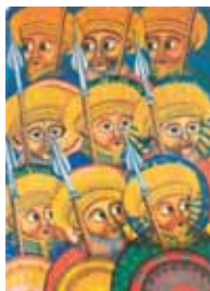
Postkarte aus Äthiopien, Oktober 2009.