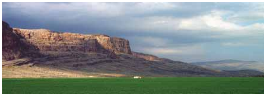
Berglandschaft in der Provinz Fars.

Die Islamische Republik Iran steht in jüngster Zeit beständig im Fokus der weltweiten Aufmerksamkeit. Im Hinblick auf die internationale Bedeutung und Position des Landes sehen wir gerade zu diesem Zeitpunkt eine besondere Notwendigkeit für gegenseitigen Austausch und Dialog. Deshalb möchten wir als Gruppe des Jahrgangs 2009 des Studentenforums einen Deutsch-Iranischen Studentendialog ins Leben rufen. Im Sinne des iranischen Sprichworts: „Berge begegnen sich nicht, aber Menschen!“, möchten wir eine Plattform schaffen, die einen Austausch der jungen iranischen Generation mit internationalen studentischen Gesprächspartnern ermöglicht.